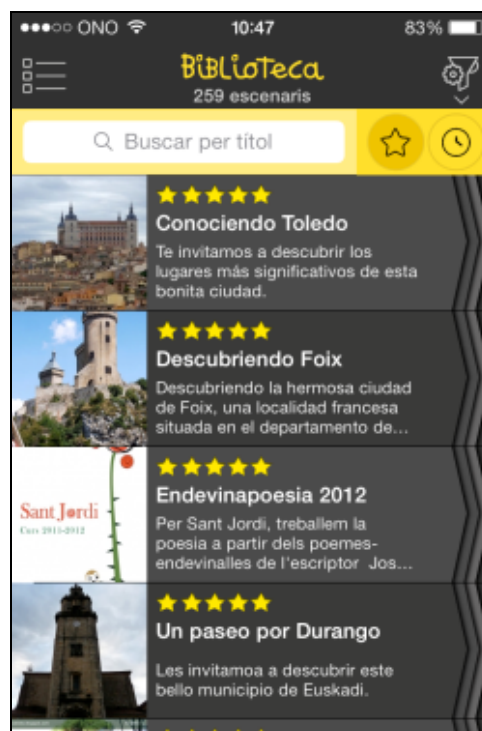
Ejemplos de escenarios vistos desde el dispositivo móvil

Podemos definir un escenario como una experiencia didáctica, enmarcada en un determinado espacio físico, que contiene una serie de objetos georeferenciados con el objetivo de trabajar un tema o un concepto utilizando un dispositivo móvil con GPS.